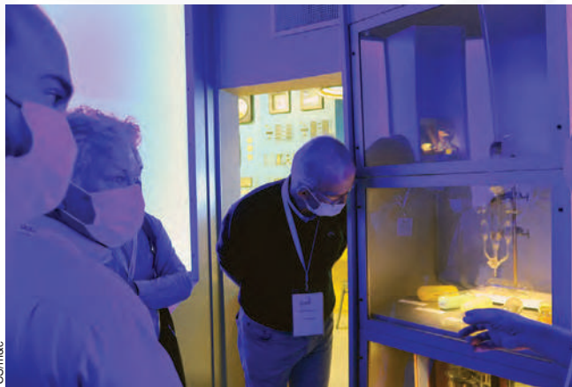
Les différentes formes transformées du minéral d'uranium.