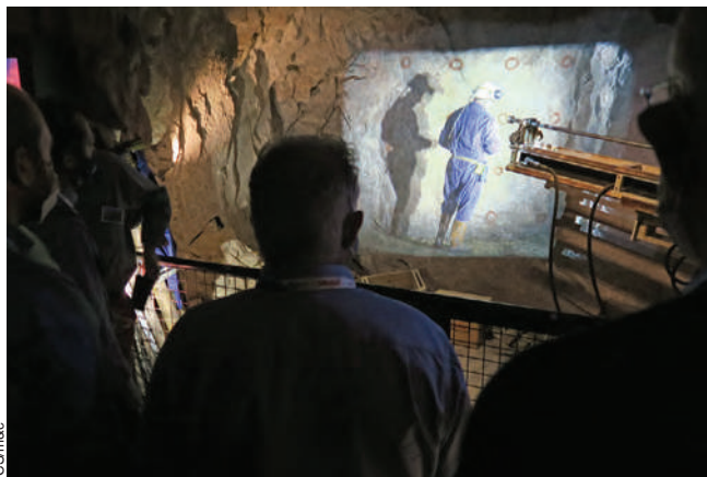
Dans une galerie souterraine, pas d'extraction sans tir.