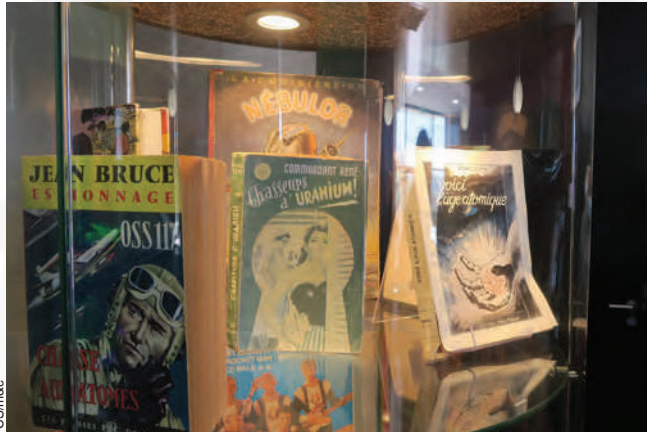
Vitrine à l'entrée du musée Ûreka.