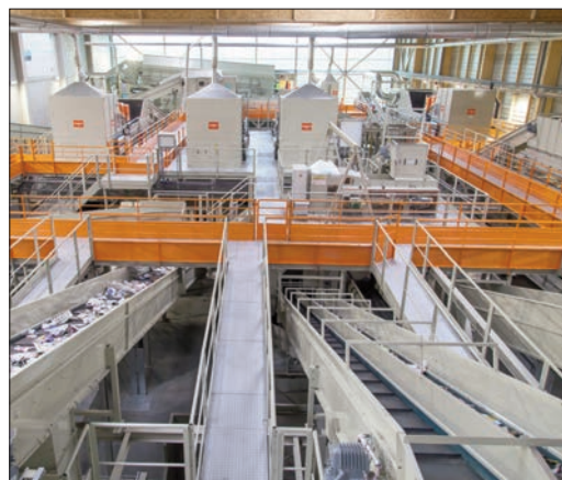
Le centre de tri Séché à Changé